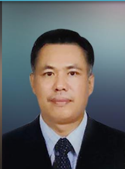
ທ່ານ ພູດທະຂັນ ຂັນຕິ ສະມາຊິກ